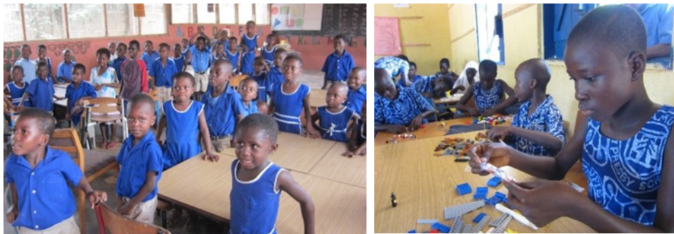
Samme lokale (oven for th) i 2013, nu med vinduer og dør (th). Beløbet til ombygningen blev delvist indsamlet på en norsk skole. Et billede fra et af skolens andre lokaler, der nu alle er blevet forsynet møbler og inventar.