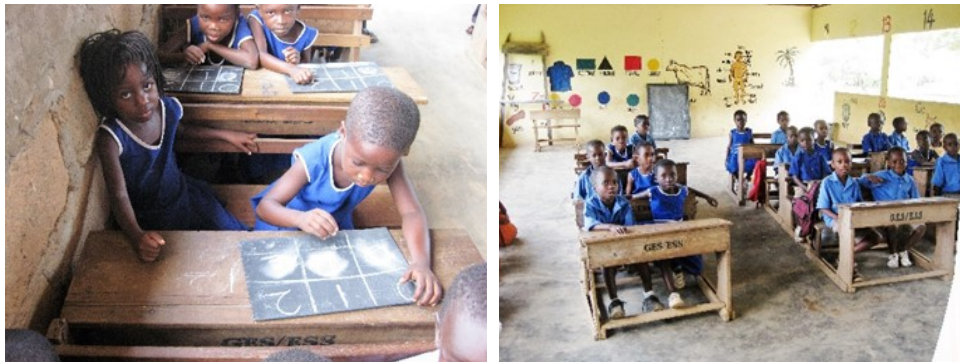
Skolen i Akwamufie 2009. Bygningen var åben i begge sider og med traditionelle møbler.