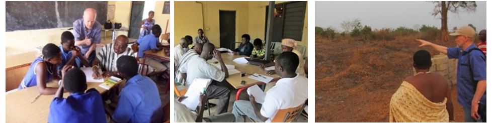
Forskellige grupper blev inddraget i projektet (tv), en styregruppe (midt) valgte småbørn som første projekt. Vi oprettede forskoler, bl.a. på denne grund (th). Gennem leg og læring skal børnene forberedes til en skolegang på engelsk, mens de hjemme taler det lokale sprog.