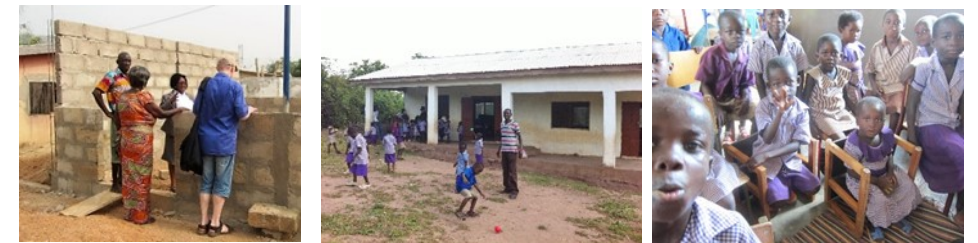
Projektet blev bevilget af CISU, og byggeriet kom langsomt i gang. Her i Akwamufie (tv). Ved vort første besøg i 2013. De to billeder (th) er fra Ayensu efter at skolen var taget i brug i 2014. Dette er en skole i en landsby fjernt fra hovedveje og elektricitet. I 2013 (herunder) blev der afholdt et åbent kursus for interesserede, og alle der opfyldte kravene fik et afgangsbevis. Flere af dem oprettede selv forskoler på eget initiativ ud over de planlagte 3.