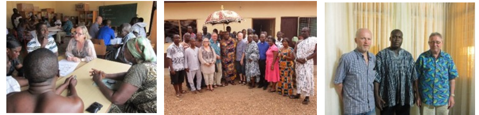
I 2012 indgik vi en partnerskabsaftale med den lokale NGO i Akwamu, Friends of Akwamu. Aftalen blev fulgt op af projektet, 'En ny fremtid for Akwamu'. Indholdet af projektet formulerede vi sammen igennem en fælles analyse. Se nedenfor.